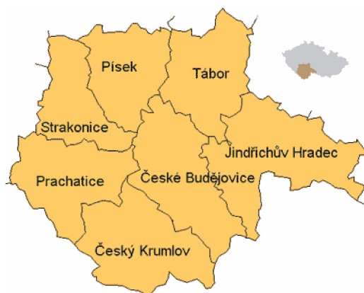
Obr. č. 1: Jihočeský kraj

Rozloha kraje činí 10 056 km 2 , což je 12,8 % rozlohy celé České republiky. Je druhým největším krajem v České republice.